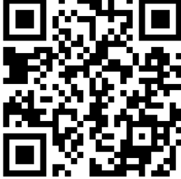
Video-1: Siber Zorba Olma, Farkına Var

Web ve iletişim teknolojisinde yaşanan hızlı gelişmelerle birlikte insanlar arasındaki iletişim ve ilişki sanal ortamlara taşınmıştır. İnsanların birbirleriyle tanışması, iletişime geçmesi, içerik paylaşımında bulunması, tartışma ortamı oluşturması ve ortak ilgi alanları etrafında gruplar oluşturması sürekli gelişen web teknolojisiyle birlikte oluşan bir durumdur. Sosyal paylaşım ağlarının dünya ile birlikte ülkemizde de kullanıcı sayısı hızlı bir şekilde artmakta, gerçek ve sanal dünya ayrımı giderek ortadan kalkmaktadır. Bu artış ile birlikte internet ve sosyal ağlar, bilinmeyen, fark edilemeyecek veya algılanması zor, pek çok tehdit ve tehlikeyi de beraberinde getirmiştir.